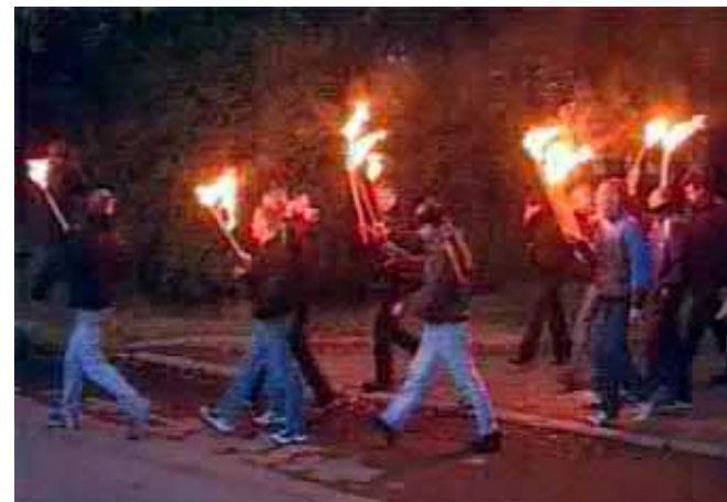
Скинхеды. Факельное шествие в Петербурге.