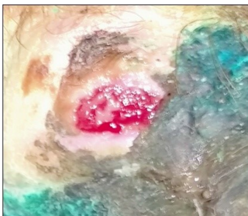
Рисунок 8 - Гнойно-некротическая язва в области пальцев у овцы.

Исходя из полученных экспериментальных данных установили оптимальную динамику заживления гнойно-некротических язв в третьей подопытной группе животных, у них наблюдался интенсивный рост грануляционной ткани и эпителизация очага. Заживление патологического очага в течении 10±2 дней (рисунки 8 -10).