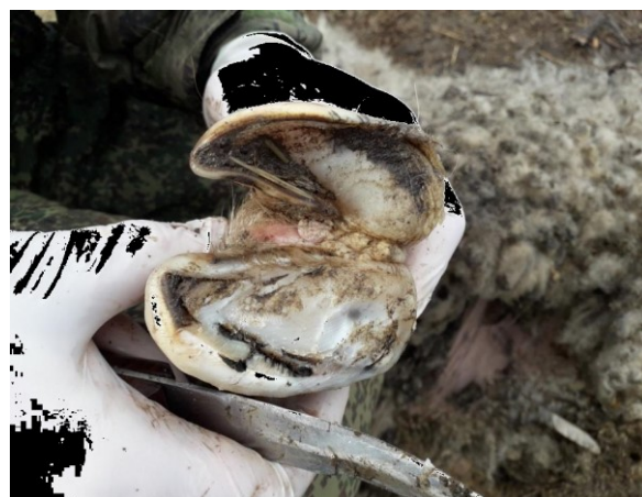
Рисунок 3 – Гиперплазия рога подошвы.

Между отросшим рогом стенки и подошвы обнаруживали пространство, где скапливался экссудат, остатки тканей, мельчайшие частицы навоза и