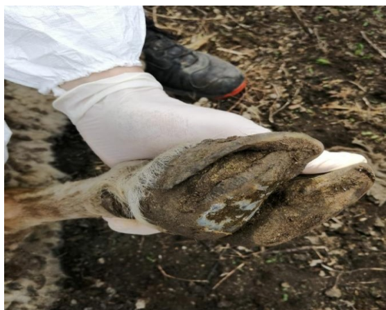
Рисунок 2 – Язва подошвы копытца овцы.

В области мякиша, подошвы и аксиальной стенки копытцевый рог был тусклый, мягкий (рисунок 2). При расчистке и обрезке копытным ножом рог подошвы легко отделялся в виде небольших кусочков. Патологические изменения рога подошвы часто сопровождалась перемежающей хромотой. При более глубоком развитии патологического процесса появлялась отечность кожи венчика (рисунок 3). Основа кожи боковой стенки подошвы и мякиша была коричневого цвета, при этом отмечалась хромота типа опирающейся конечности.