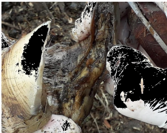
Рисунок 4 – Отслоение копытцевой стенки.

корма (рисунок 4). Отмечали неравномерность толщины удлинённой роговой стенки с тусклой, шероховатой поверхностью, постепенно принимающий форму изогнутой трубки (рисунок 5).