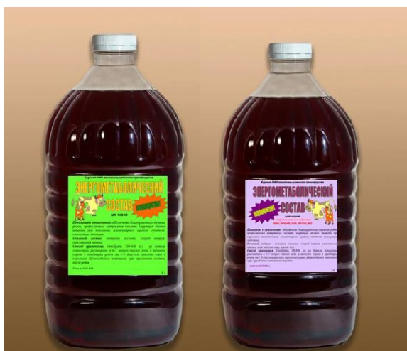
Рисунок 11 – Энергометаболический состав.

Заболевания дистального отдела конечностей мелкого рогатого скота полиэтиологичны, они наносят значительный экономический ущерб животноводческим хозяйствам, складывающийся из снижения продуктивности больных овец и затрат на проведение лечебных и профилактических мероприятий. Поэтому нами был разработан и проведен в хозяйствах комплекс профилактических мероприятий.