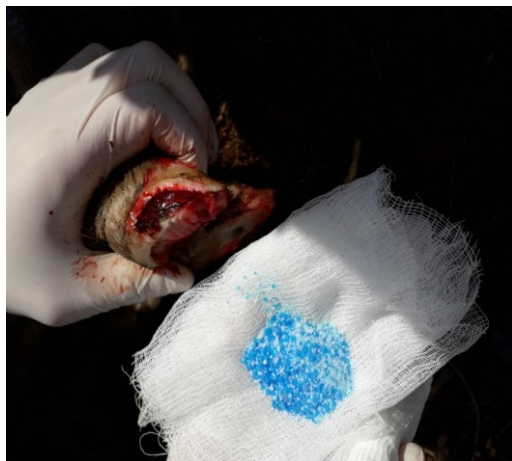
Рисунок 6 – Нанесение порошка на язвенную поверхность копыльца.