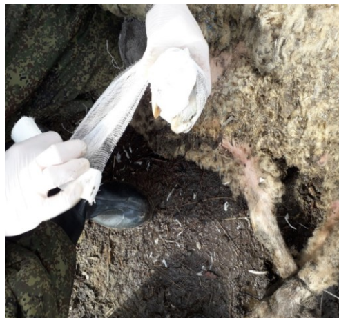
Рисунок 7 – Наложение защитной повязки.

Клиническая оценка заживления гнойно-некротических язв дистального отдела конечностей у овец представлена в таблице 3.