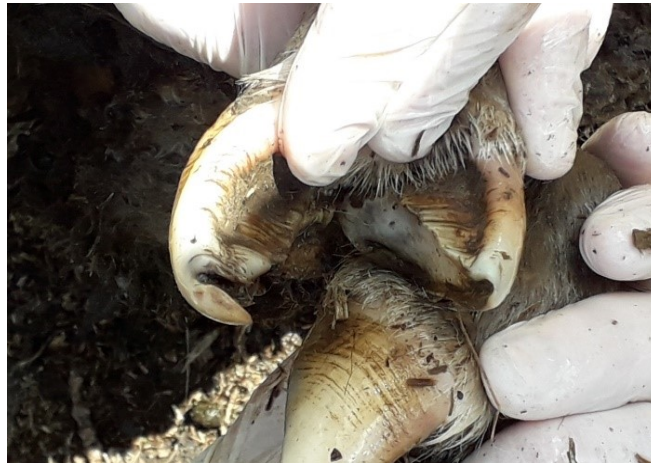
Рисунок 5 – Деформация копытцевой стенки.

Для лечения овец с гнойно-некротическими поражениями дистального отдела конечностей нами было предложено новое лекарственное средство. При его разработке мы ставили цель изготовить препарат из дешевых и доступных в условиях производства компонентов, обладающих не только бактерицидным действием, но и стимулирующим процесс заживления патологического очага.