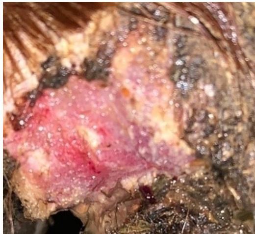
Рисунок 10- Эпителизация язвы копытца у овцы на десятые сутки.

При проведении научных исследований мы определяли основные показатели крови и биохимический статус здоровых животных в контрольной (интактной) группе и больных овец с гнойно-некротическими поражениями в области пальцев в подопытных группах.