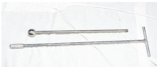
Рисунок 1 – Клюка для выведения полового члена в область промежности

Клюка для выведения полового члена жеребца в область промежности состоит из двух соединяемых между собой резьбовым соединением частей. И представляет собой металлический стержень, при этом один конец стержня снабжен рукояткой, а другой – шарообразным элементом, внутри которого находится отверстие, перпендикулярное оси стержня, через которое пропускается и закрепляется бинт.