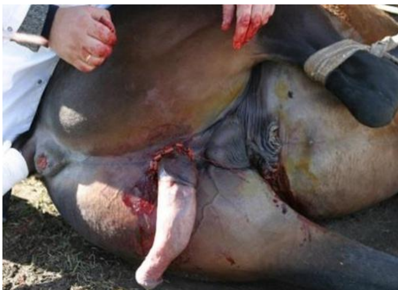
Рисунок 2 – Полностью ушитая операционная рана

Третий этап: наложение швов на края раны. Соединяли края раны кожи промежности и препуция, затем накладывали швы валиком с прокладкой из стерильной резиновой трубки во избежание травматизации кожи и расхождения краев раны из-за сильного натяжения. Для ушивания раны использовали иглодержатель Гегара, иглы хирургические изогнутые №25 или 29, шелк № 8. Первый шов накладывали со стороны анального отверстия, второй напротив него – со стороны мошонки. Затем, двигаясь по направлению часовой стрелки, поэтапно накладывали швы с каждой стороны, таким образом, ушивая всю рану. Швы накладывали с соблюдением правил асептики и антисептики, поэтапно напротив друг друга для равномерного натяжения кожи, расстояние между швами – 1 см, длина стежка – 1 см.