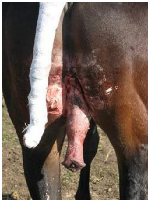
Рисунок 3 – Вид жеребца №2 (кличка Март) после операции

Кровотечение при данной операции незначительное. Чтобы не допустить возникновения отеков со второго дня после операции жеребцу назначали проводку, через две недели – выпускали в табун.