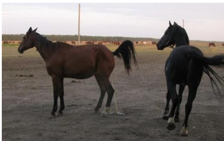
Рисунок 4 – Реакция кобылы Примы в охоте на жеребца-пробника

была розоватого цвета. Количество слизи увеличивалось, и она становилась более прозрачной по сравнению с исследованием при охоте первой степени. В третью степень проявления течки шейка матки становилась короткой, широкой, похожей на розетку; мускулатура ее сокращалась и расслаблялась; канал был раскрыт на ширину шириной в 2-3-х пальцев. Слизистая оболочка влагалища розовая, гладкая. Четвертая степень проявления охоты выражалось сильно размягченной шейкой матки; канал ее был широко раскрыт – ширина устья составляла 3-4 пальца; шейка сильно сокращалась, принимая форму соска и расслаблялась розеткой (3-4 см в диаметре). Слизь имела прозрачный, блестящий цвет, тягучую консистенцию, тянулась между пальцами в виде тонких нитей. Слизистая оболочка влагалища была цианотичной и матовой.